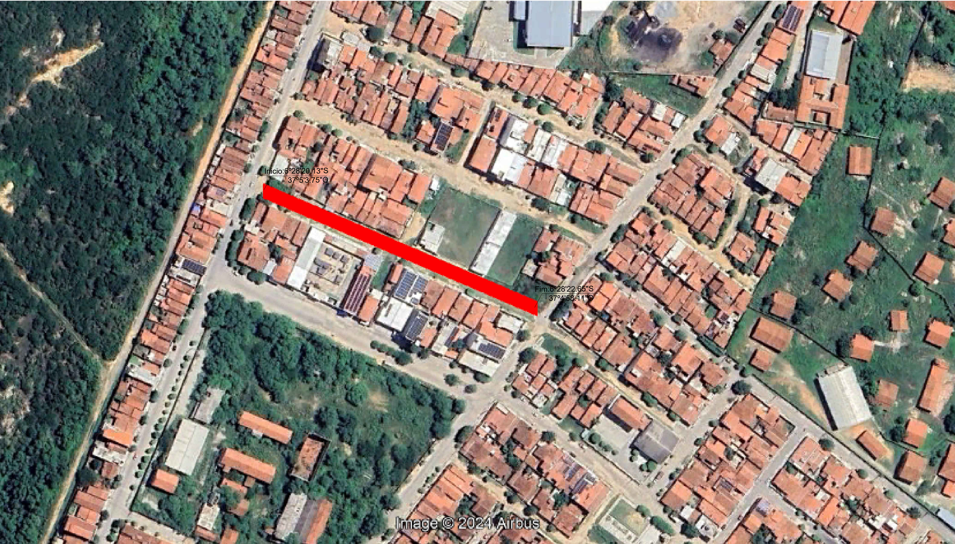
PLANTA DE SITUAÇÃO Pavimentações, Caicó/RN Sem escala