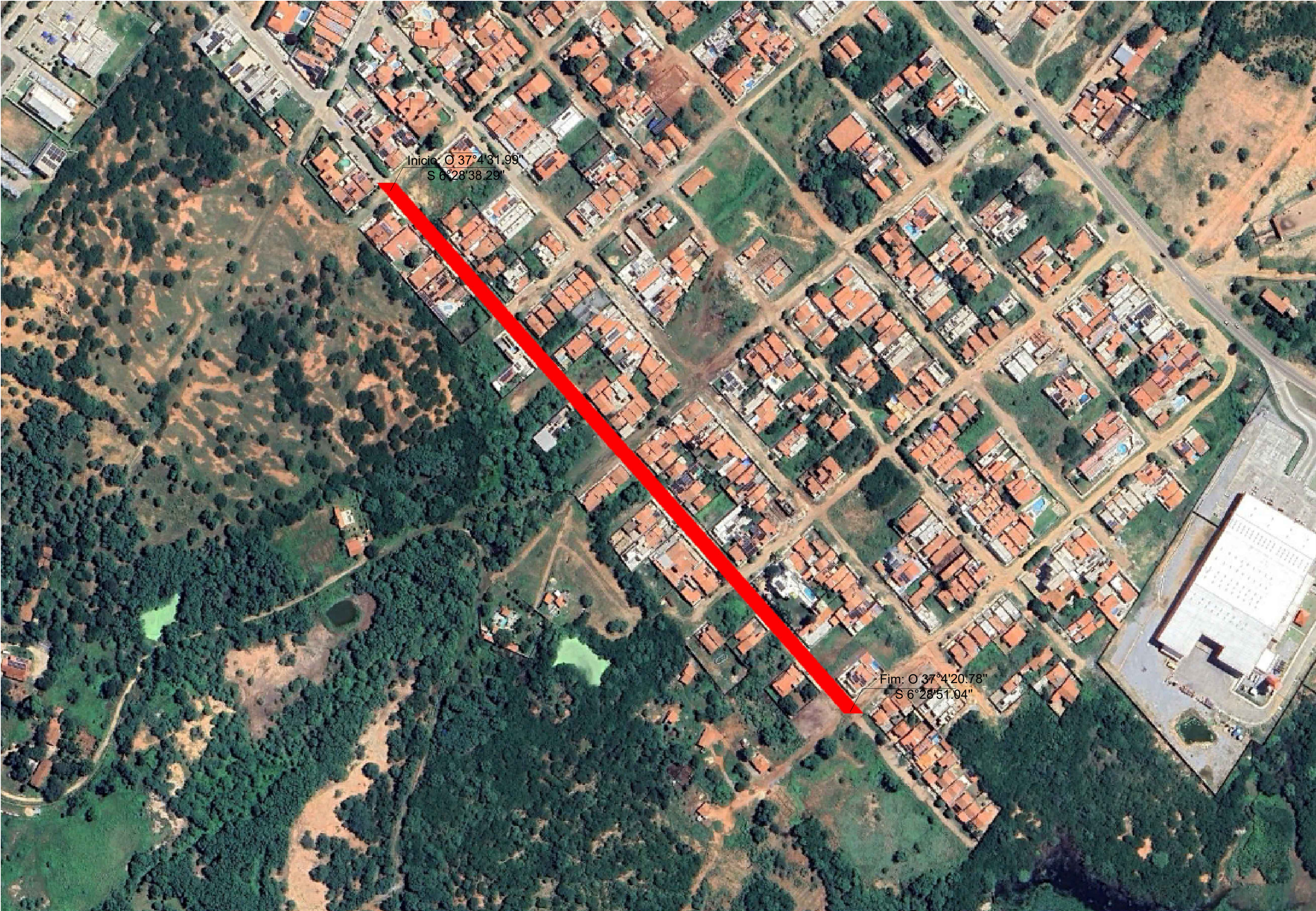
PLANTA DE SITUAÇÃO Pavimentações, Caicó/RN Sem escala