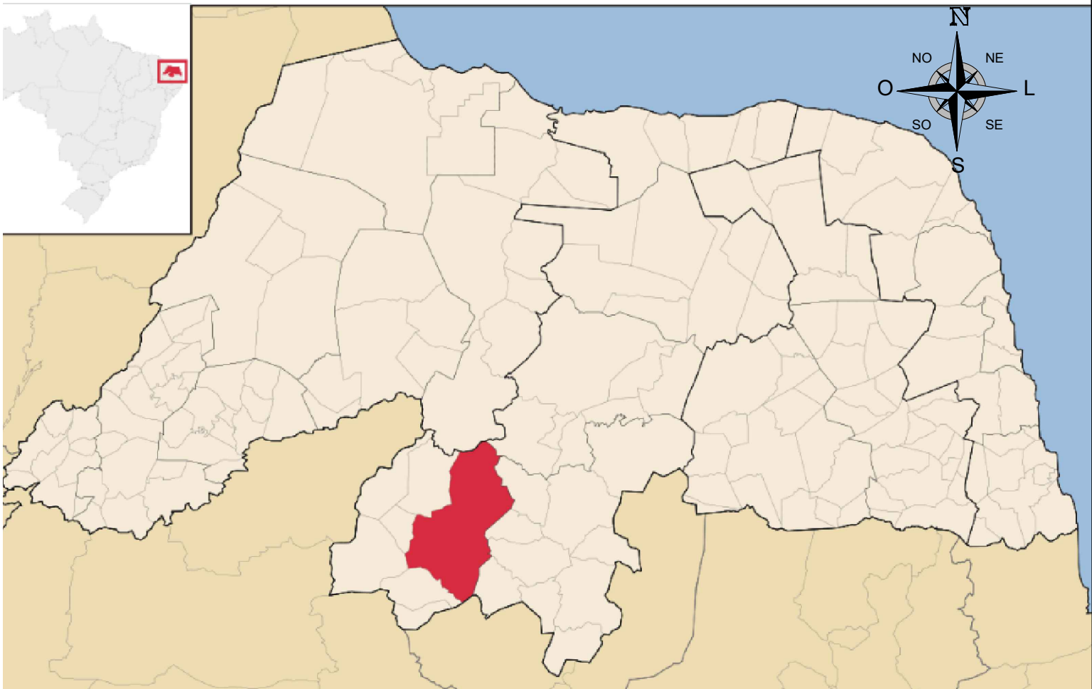
PLANTA DE LOCALIZAÇÃO Pavimentações, Caicó/RN Sem escala

LEGENDA = RUA A SER PAVIMENTADA NESTE CONTRATO