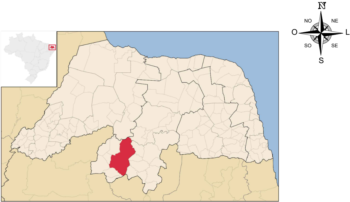
PLANTA DE LOCALIZAÇÃO Pavimentações, Caicó/RN Sem escala